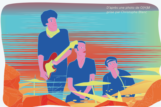
D'après une photo de O(H)M prise par Christophe Blanc

Tout commence avec un drôle d'objet, entre monolithe de science-fiction et totem chimérique, qui attire l'attention de trois « triturateurs » de sons en panne d'inspiration... À force de manipulations, ils déclenchent accidentellement une première vibration. Pour prolonger et enrichir cette première résonance, les triturateurs s'agitent et accumulent autour du totem-monolithe tout un tas d'instruments, de câbles, de pédales, d'enceintes et de machines... Dans ce récit décalé et graphique, les trois musiciens-compositeurs entraînent petits et grands à la découverte des échos du jazz, du rock et de leurs inépuisables variations.