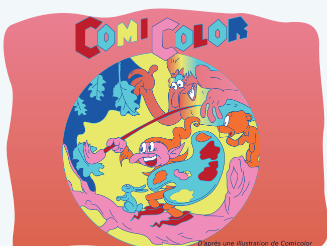
D'après une illustration de Comicolor