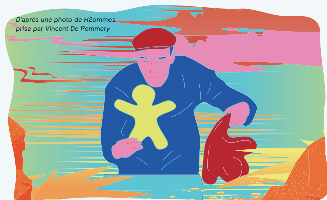
D'après une photo de H2ommes prise par Vincent De Pommery

Hors les murs : Rêverie électronique est jouée également cet automne, le mercredi 17 octobre, au centre social Couleur quartier de Kerourien. En plus de 2 séances dédiées aux enfants des structures du quartier, une séance pour les familles est accessible à tous, à 17h. > Renseignements et inscription au 02 98 34 16 40